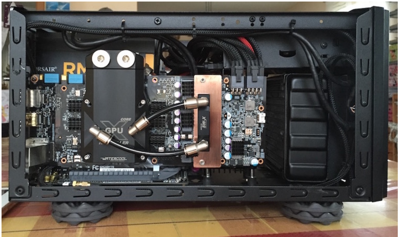
Radi&Pumpe eingebaut (ohne Netzteil, Kabel und Platten):