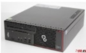
Fujitsu Esprimo C720 Intel i5 8GB RAM 120GB / 240GB SSD SanDisk