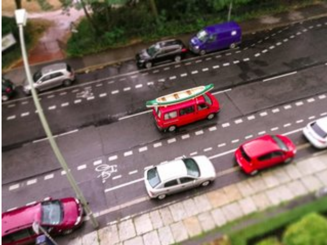
Kanu auf's Dach...

Bin mal wieder unterwegs gewesen, dieses Mal von den Rheinsberger Gewässern, dann die Havel aufwärts bis fast zu den Quellseen