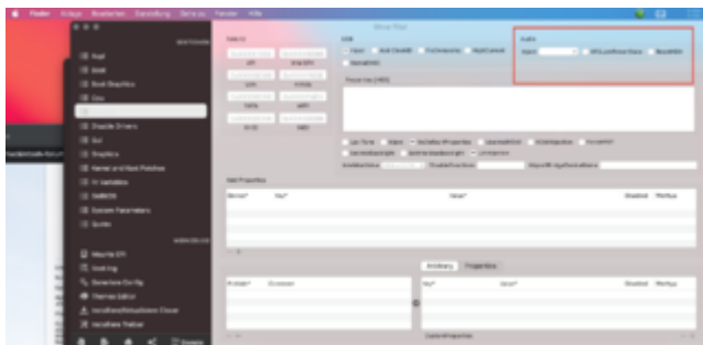
rot markiert die Stelle 'welche wichtig ist' im