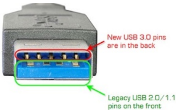
USB 3.0 Male A-Type Connector Showing the pins used for USB 2.0 vs. 3.0

meinerseits. Ich habe mir mal genauer angesehen, wie eine USB3.0 Steckverbindung zwischen HS und SS hardwareseitig zustande kommt: